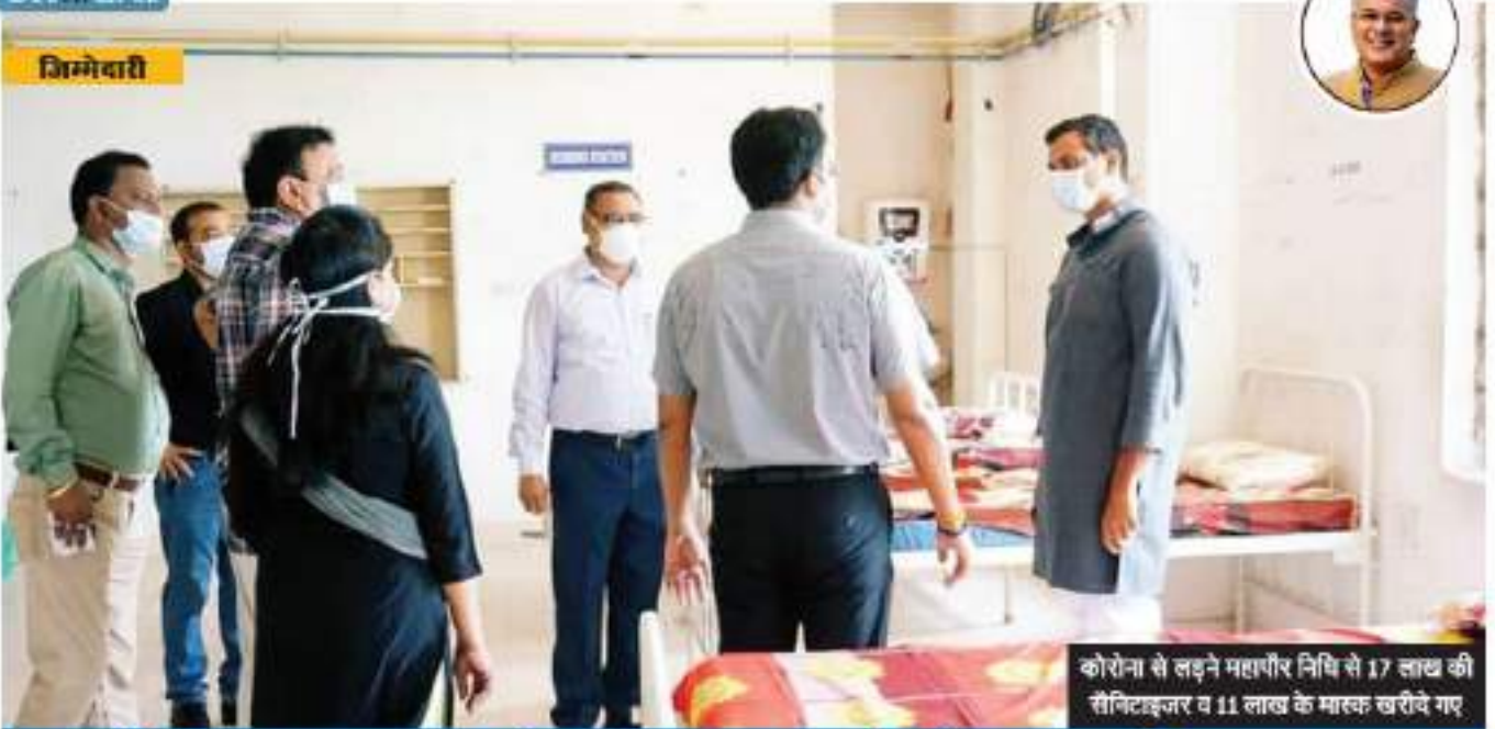
कोरोना से लड़ने महापौर निधि से 17 लाख की सैनिटाइजर व 11 लाख के मास्क खरीवे गए