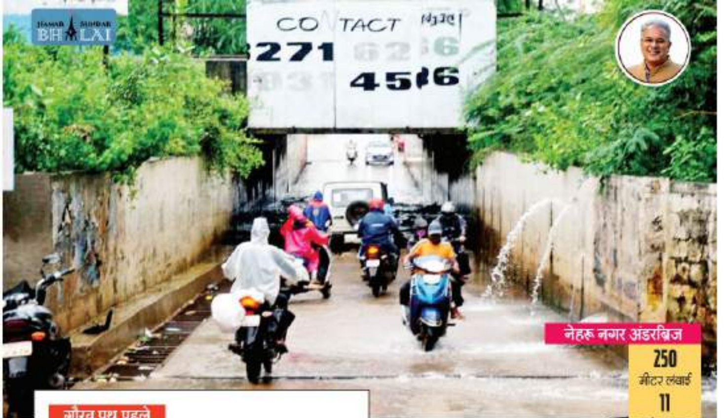
नेहरू नगर अंडरब्रिज