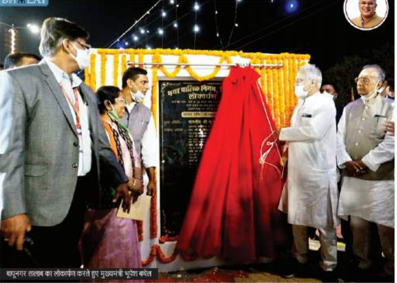
शहपूरनगर तालाब का लोकार्पण करते हुए मुख्यमंत्री भूपेश बघेल